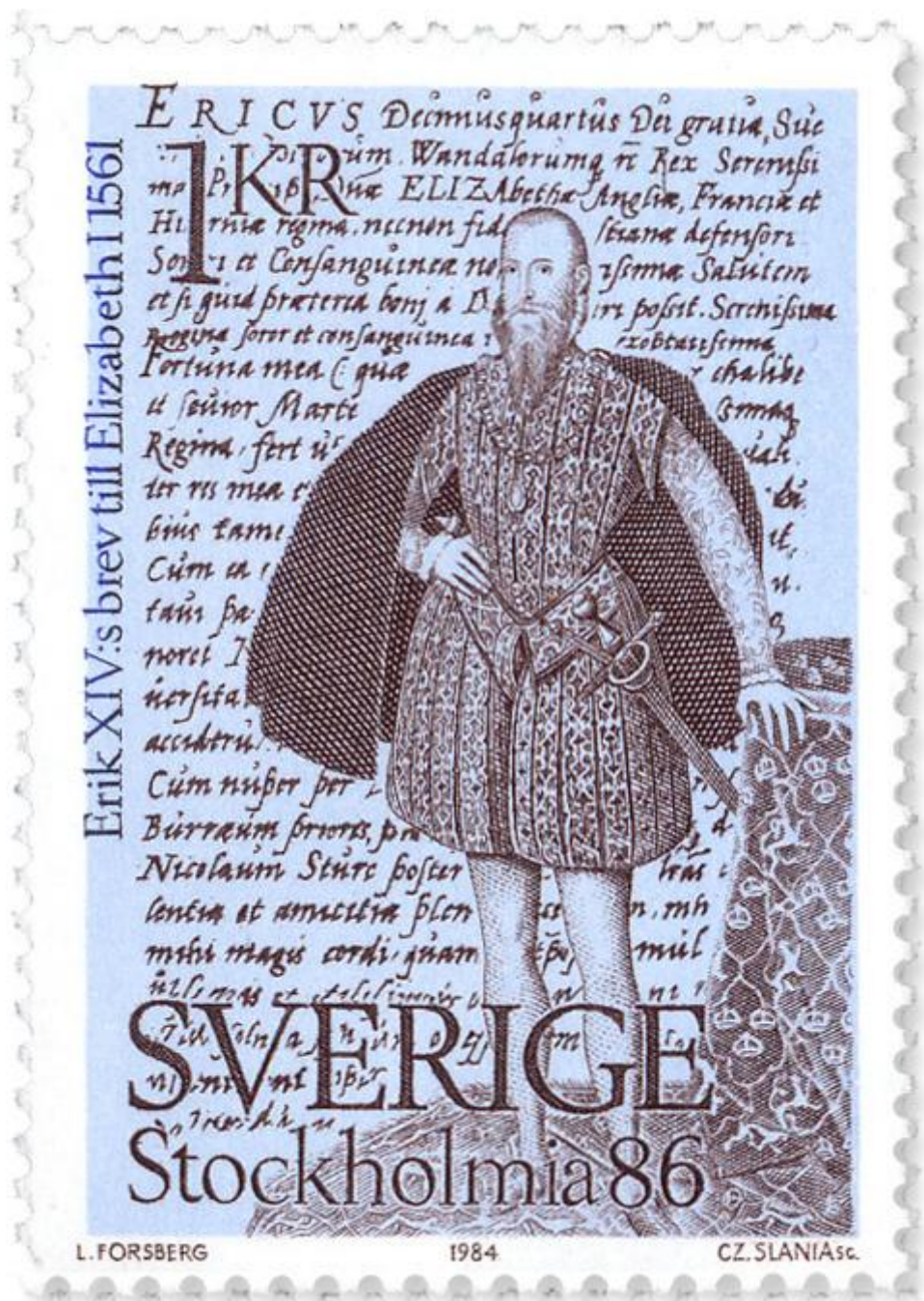
Erik XIV (1533-1577) var Gustav Vasas äldste son och han övertog tronen efter faderns död 1560. Hans tid som Sveriges konung varade fram till 1568, då han avsattes av sina bröder. Återstoden av sitt liv kom Erik att tillbringa i fångenskap, bland annat på Västerås slott. Han är begravd i Västerås domkyrka.