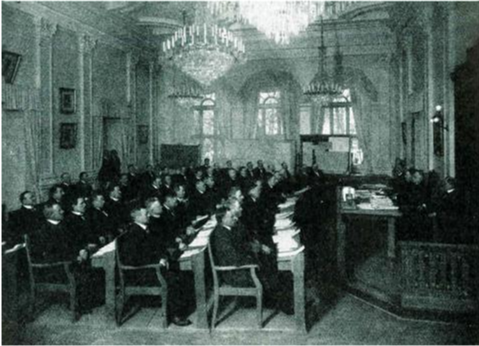
Stora sessionssalen i Västerås rådhus.