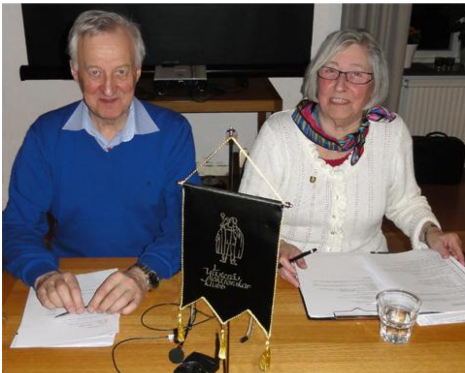
Årsmötet den 20/3 leddes av Brage Lundström med Karin Jyrell som sekreterare.