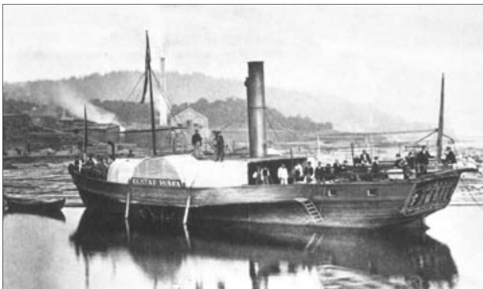
Ångbåten Gustaf Wasa. Redan på 1820-talet hade ångbåtar börjat trafikera Mälaren. De var byggda i trä och drevs framåt med hjälp av två skovelhjul, ett på vardera sida av båten.