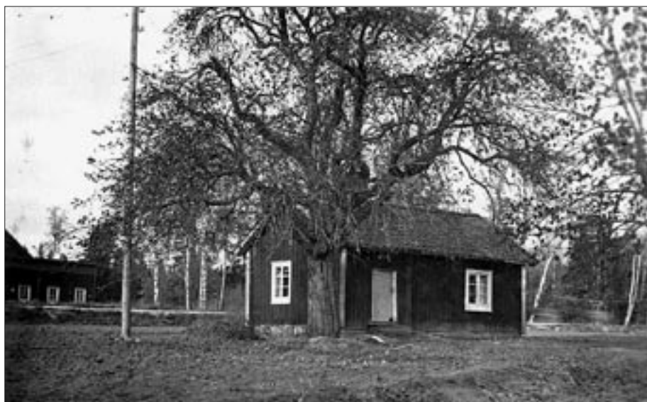
Norra Ryttartorpet i Tibble. Ett soldat- torps tomt skulle omfatta kåltäppa, åker om ett halvt tunnland samt äng för två lass hö. Det skulle också finnas ett fähus med loge. Torpets mått var c:a 7x5 m. Det ursprungliga torpet ligger kvar vid Tortunavägen men är idag tillbyggt.