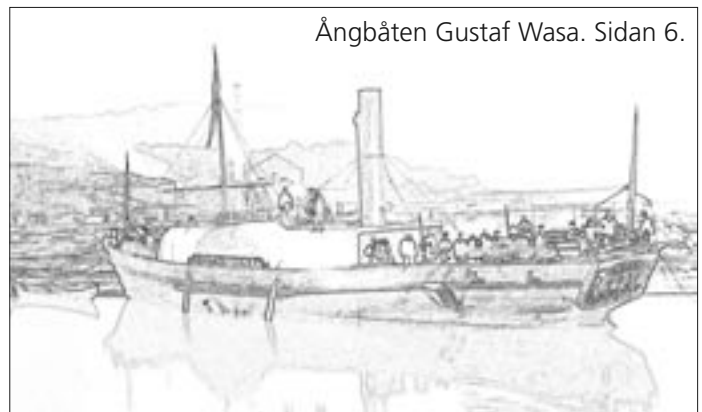
Ångbåten Gustaf Wasa. Sidan 6.